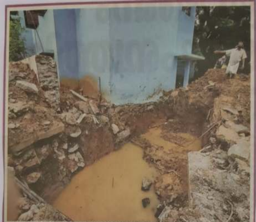
പാലക്കാട് ഗവ. മോയൻ എൽപി സ്കൂൾ കെട്ടിടത്തിന്റെ അടിത്തറയോടു ചേർന്നുള്ള ഭാഗത്തെ മണ്ണു നീക്കം തിരിച്ചറിഞ്ഞ്

ഇത്തരത്തിൽ കുട്ടികളുടെ അക്കാദമിക അനക്കാദമിക കാര്യങ്ങളിൽ ഇടപെട്ടുകൊണ്ട് തന്റെ ശക്തമായ സാന്നിധ്യം PTA എല്ലാക്കാലവും നിലനിർത്തുന്നു. ഇതാണ് മോയൻ എൽപിയെ മികച്ച സ്കൂൾ എന്ന തലത്തിലേക്ക് ഉയർത്തുന്നത്