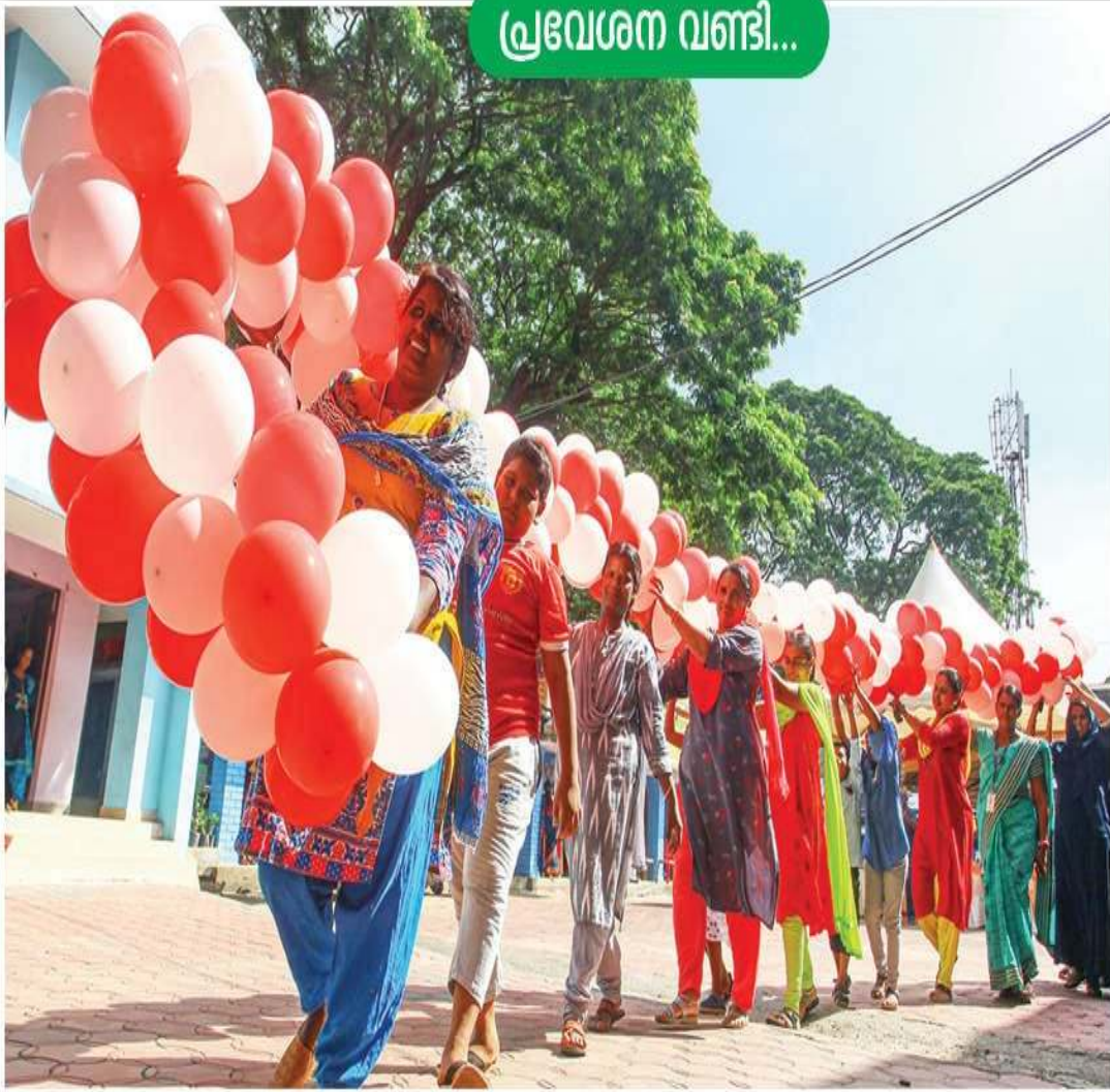
മധ്യവേനലവധിക്കാലം കഴിഞ്ഞ് സ്കൂളുകൾ തുറക്കുന്നതിന് മുന്നോടിയായി അലങ്കരിക്കാനായി വിർപ്പിച്ച ബലൂണുകൾ കവാടത്തിലേക്ക് കൊണ്ടുപോകുന്ന അധ്യാപകരും വിദ്യാർത്ഥികളും രക്ഷിതാക്കളും. പാലക്കാട് മോയൻ എൽ.പി. സ്കൂളിൽ നിന്നുള്ള ദൃശ്യം