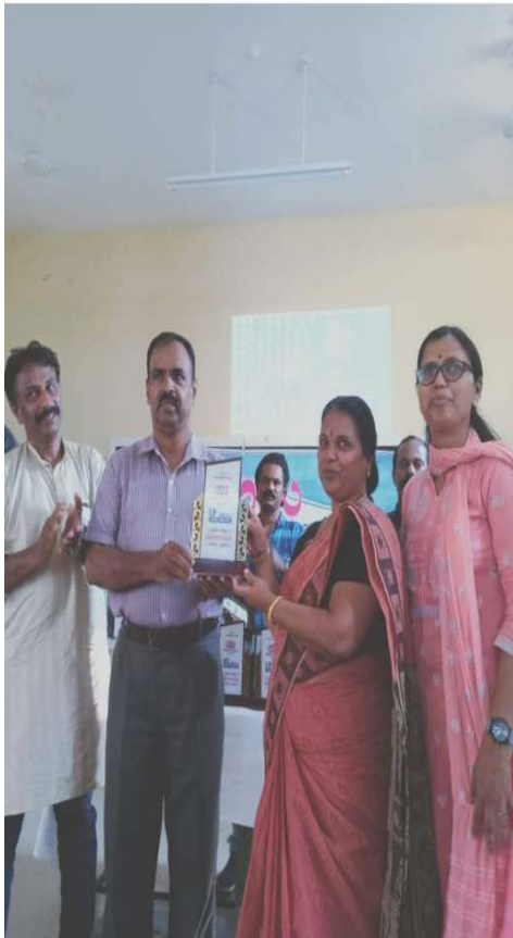
ശ്രദ്ധ ജില്ലാതലം ഒന്നാം സ്ഥാനം

മലയാളം, ഇംഗ്ലീഷ് , പരിസരപഠനം, ഗണിതം തുടങ്ങി എല്ലാ മേഖലയിലും പിന്നോക്കാവസ്ഥ നേരിടുന്നവർക്കായുള്ള പരിപാടി ഇത്തരം പരിപാടികൾ സ്കൂളിൽ നടക്കുമ്പോൾ കുട്ടികൾക്ക് വേണ്ട ലഘുഭക്ഷണമൊരുക്കൽ, അധ്യാപകർക്കൊപ്പമിരുന്ന് കുട്ടികളെ സഹായിക്കൽ, പഠനോപകരണങ്ങൾ ഒരുക്കൽ, തുടങ്ങിയ മേഖലകളിലെല്ലാം രക്ഷിതാക്കൾ സഹായിച്ചു വരുന്നു.