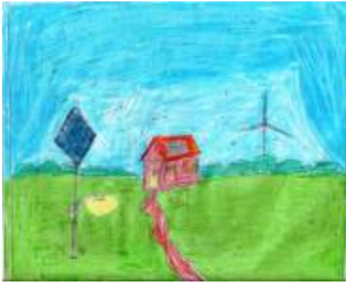
സഫ്ത മോൾ VI.C