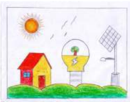
സഫ്ത ഫാത്തിമ ഏൻ എസ് VI.C