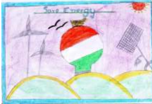
മിൻഹ ഫാത്തിമ V.I.E