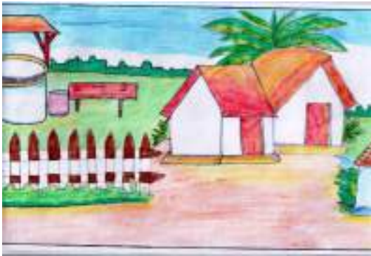
കൃതിക ആർ എസ് VII.B