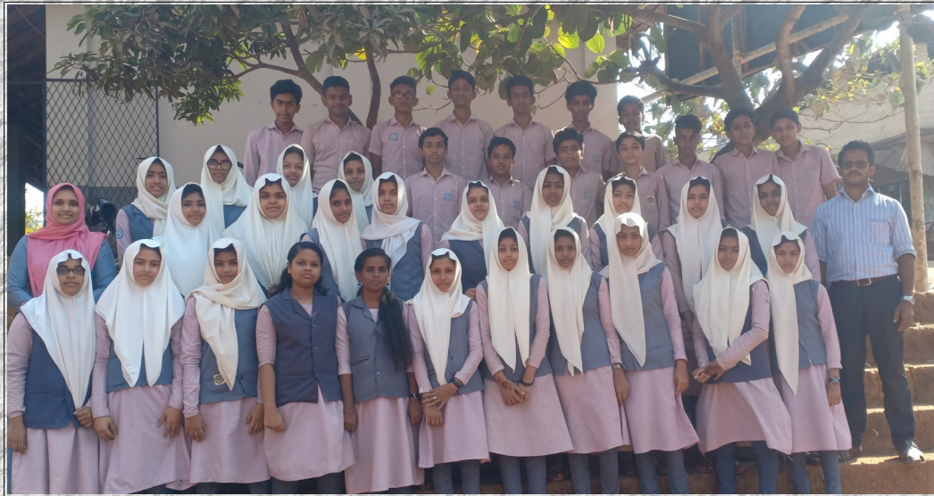
LITTLEKITES 2019-2020 TEAM