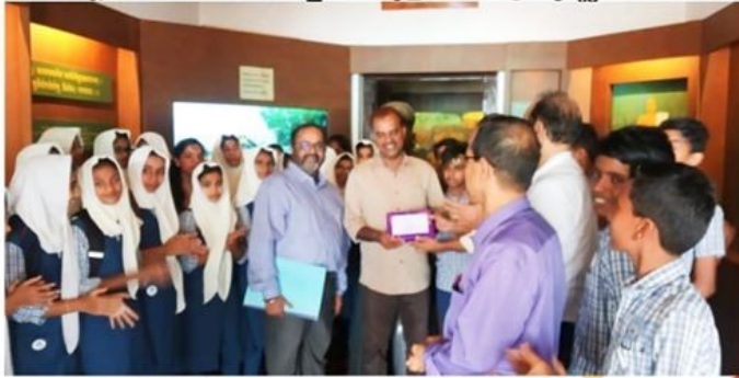
ആര്യവൈദ്യശാലയുടെ സ്കൂളിനുള്ള ഉപഹാരം നൽകുന്നു