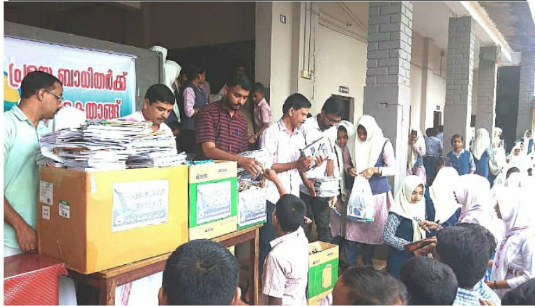
പ്രളയ ബാധിത പ്രദേശങ്ങളിലെ വിദ്യാർത്ഥികൾക്കുള്ള പഠനോപകരണങ്ങൾ നൽകുന്ന വിദ്യാർത്ഥികൾ