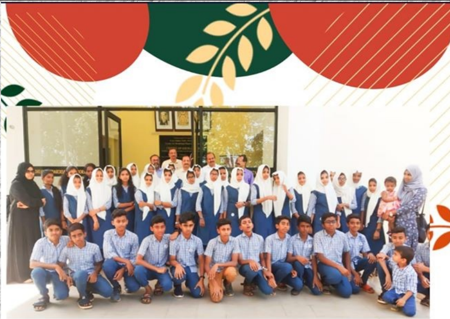
കോട്ടക്കൽ ആര്യവൈദ്യശാല, മ്യൂസിയം, തുഞ്ചൻ പറമ്പ്, അഴിമുഖം എന്നിവ സന്ദർശിച്ച സ്കൂളിലെ ആയുർ ക്ലബ്ബ് അംഗങ്ങൾ