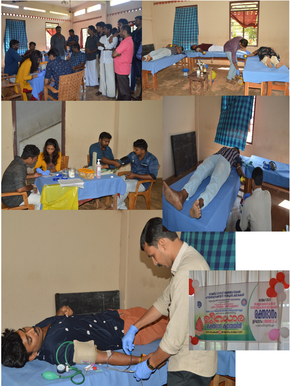
രാജീവ് ഗാന്ധി മെമ്മോറിയൽ എച്ച്.എസ്.എസ്.മൊകേരി