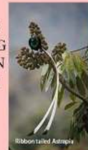
Ribbon tailed Astrapia

FALCON IS THE FASTEST FLYING BIRD. THEY CAN TRAVEL 390 KM IN AN HOUR.