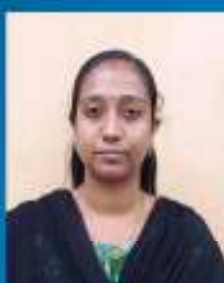
വിശ്വല ഞാൽ പി