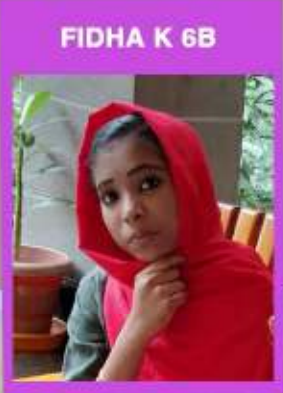
FIDHA K 6B