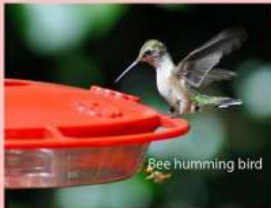
Bee humming bird

THE BIGGEST BIRD IS OSTRICH . THEY COMMONLY FOUND IN AFRICA. THEY CAN RUN FAST WITH LONG AND STRONG LEGS.