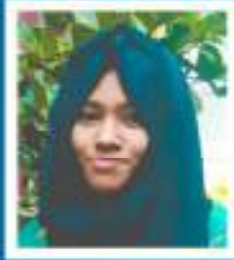
ഫാത്തിമ സഹ. പി. വി (USS)