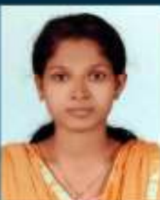
ബിബി പി ടി