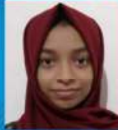
ഹിന. പി (USS)