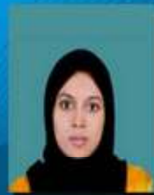
അൻസാർ ബിനം ടി