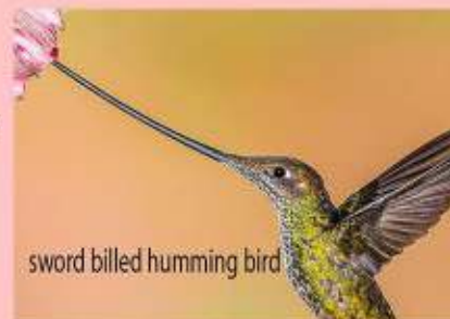
sword billed humming bird

THE LOUDEST BIRD IS WHITE BELLBIRD . THEY COMMONLY FOUND IN GUIANAS.