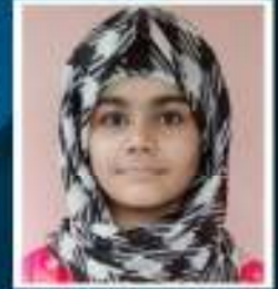
ഫാത്തിമ നൈഷാമ (USS)