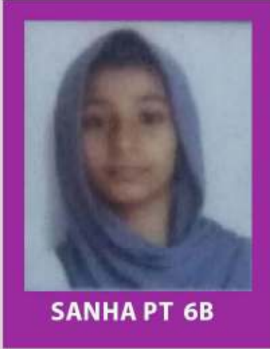
SANHA PT 6B