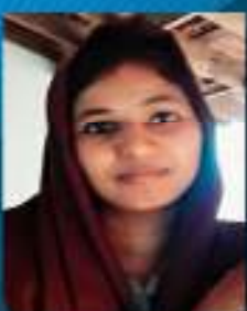
സഫ്വന (പ്രി പ്രൊഫസി)