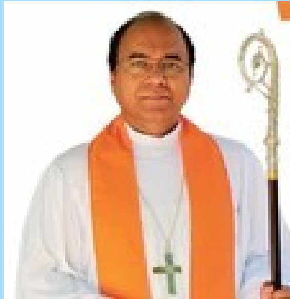
റെവ.ഡോ.റോയിസ് മനോജ് വിക്രമ്(ബിഷപ്പ്)