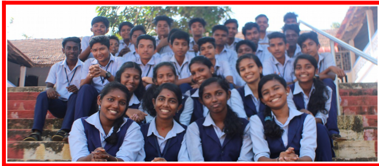
2018 – 2020