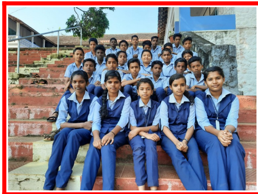
2020 – 2022