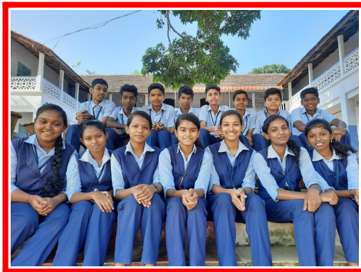
2019 – 2021