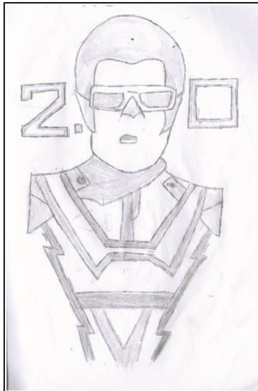
By Sreejith K B 9H