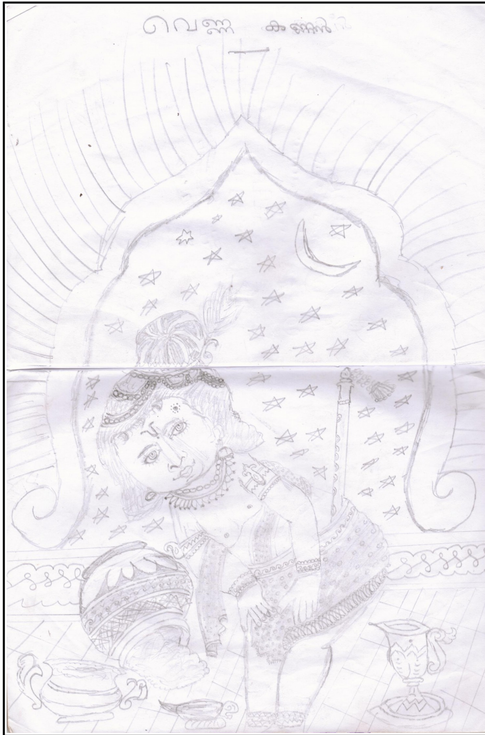
By Joyal Joshy 9 F