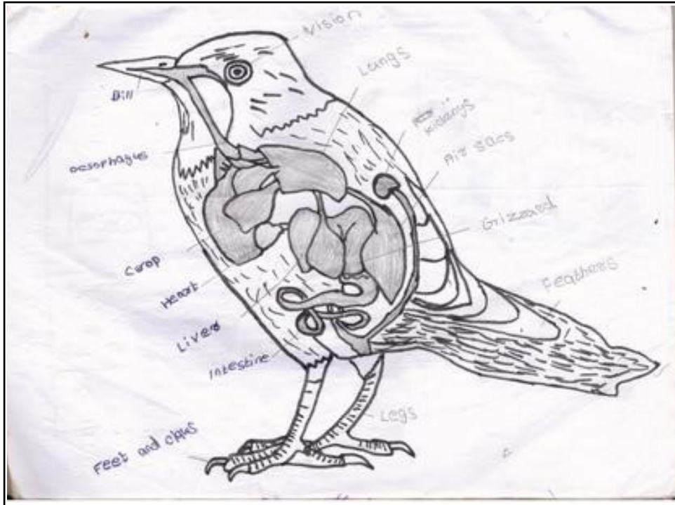
By Suraj S 9 G