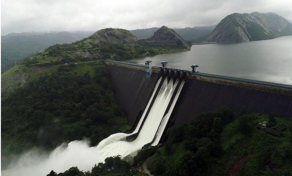
- Hashina mol 9A