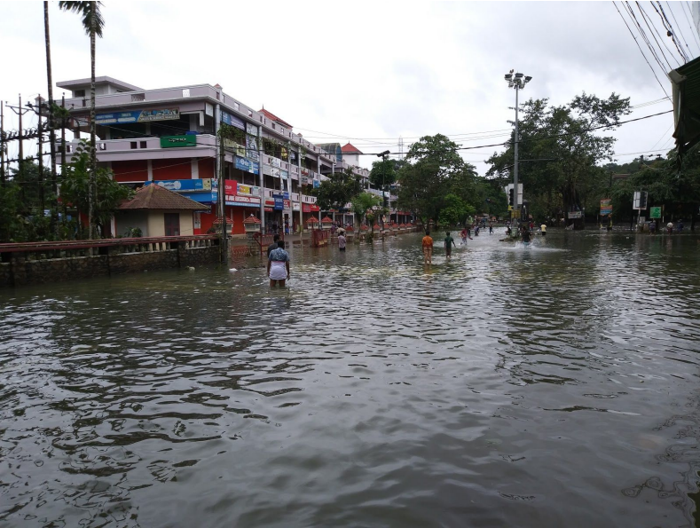
എല്ലാവരും ഒറ്റക്കെട്ടായി നിന്നു.

കേരളം കടുത്ത ചൂടിൽ നിൽക്കുമ്പോൾ പതിവുപോലെ മഴ പെയ്തിറങ്ങി, നിരന്തരം പെയ്തുകൊണ്ടിരുന്ന മഴയ്ക്ക് പുഴകളും നദികളും കായലുകളും ഡാമുകൾ മറ്റു ജലാശയങ്ങളും നിറഞ്ഞു. ജലനിരപ്പ് ഉയർന്നതിനെത്തുടർന്ന് കേരളത്തിൽ ഇടുക്കി ഡാം ഉൾപ്പെടെ 26 ഡാമുകളുടെ ഷർട്ടുകൾ ഉയർന്നു. ഇതിനോടകം തന്നെ കരകവിഞ്ഞൊഴുകാൻ തുടങ്ങിയ ജലത്തിനു മീതെ ഡാമിലെ ജലം ഒരു തിരമാല പോലെ കടന്നുപോയി. കേരളം ഭയന്ന് തുടങ്ങി. രക്ഷാപ്രവർത്തനത്തിന് സർക്കാറും ജനങ്ങളും