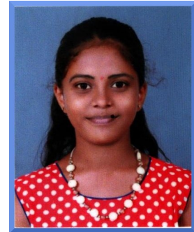
Ahalya 5 A

And we can use abundant, words to describe it.