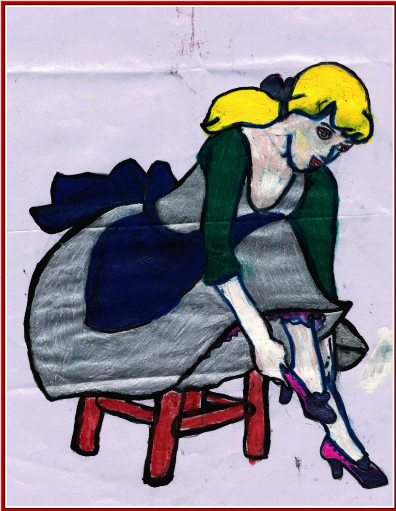
LEKSHMI PRIYA 7 A