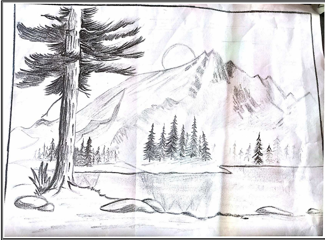
Arjun T Aghilesh 10.M