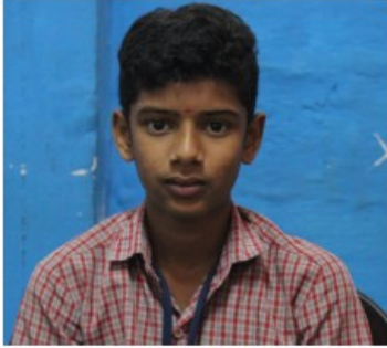
ദിത്തിൽ കെ ദിലീപ് ഷീറ്റ് മെറ്റൽ വർക്ക്