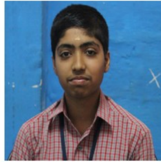
അനന്തകൃഷ്ണൻ കെ ശാസ്ത്രോത്സവം