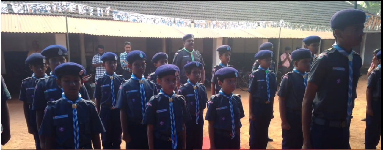
Student service organisations