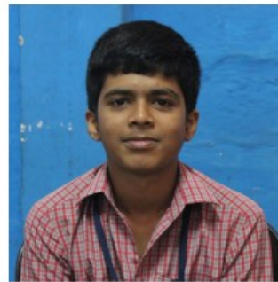
രോഹിത്ത് എം.എസ് സംസ്കൃതം പ്രശ്നോത്തരി ഐ.ടി ക്വിസ്സ്