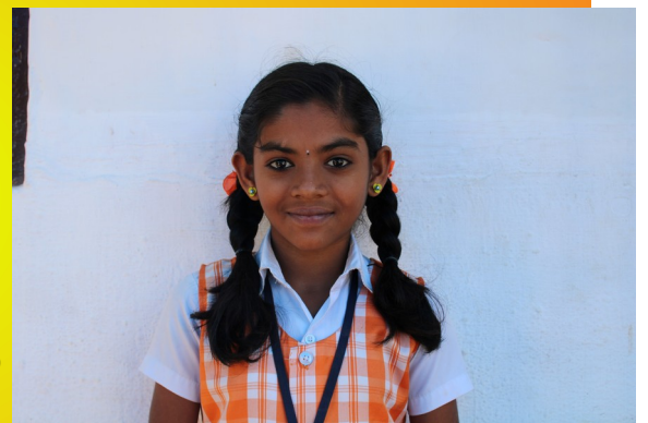
സ്വാതി 7 A

പ്രകൃതി നമ്മുടെ ആശ്രയം പ്രകൃതിയെ നമ്മൾ കാക്കുവിൻ പ്രകൃതി എന്ന വരദാനത്തെ വളർത്തി വലുതാക്ക