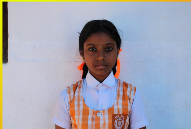
AMALU 6 A

പാക്കിസ്ഥാനിലെ സ്വാത്ത് ജില്ലയിലെ മിങ്കോവയിലാണ് ജനനം. സിയാവുദ്ദീൻ യൂസഫാണ് പിതാവ്. തൊർപ്പിക്കായി യൂസഫ് സായിയാണ് മാതാവ്. പഷ്തൂൺ കവിയും പോരാളിയുമായ മലാലയി ഓഫ് മായിവന്ദിനോടുള്ള ഇഷ്ടമാണ് മലാലയ്ക്ക് പിതാവ് ആ പേരിടാൻ കാരണം. വിദ്യാഭ്യാസ അവകാശ പ്രവർത്തകയായി അവളെ മാറ്റിയതും അദ്ദേഹമായിരുന്നു. 2008 ലാണ് വിദ്യാഭ്യാസ അവകാശത്തെക്കുറിച്ച് മലാല ആദ്യമായി പൊതുവേദിയിൽ സംസാരിക്കാൻ തുടങ്ങിയത്. പെൺകുട്ടികൾ സ്കൂൾ വിദ്യാഭ്യാസം നേടുന്നതിനെതിരെയുള്ള താലിബാന്റെ നിരോധനാജ്ഞയോടുള്ള പ്രതിഷേധത്തിന്റെയും അതുമായി ബന്ധപ്പെട്ട സാമൂഹ്യ പ്രവർത്തനങ്ങളുടെയും പേരിലാണ് മലാല പ്രശസ്തി നേടിയത്. പതിനൊന്നു വയസ്സുള്ളപ്പോൾ മലാല ബി.ബി.സിക്കുവേണ്ടി എഴുതുവാൻ തുടങ്ങിയ ബ്ലോഗാണ് അവളെ ആദ്യം ശ്രദ്ധയിൽ കൊണ്ടുവന്നത്.