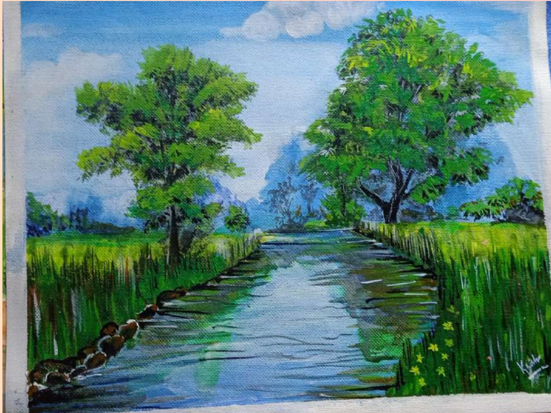
KRISHNA PRABHA 9B