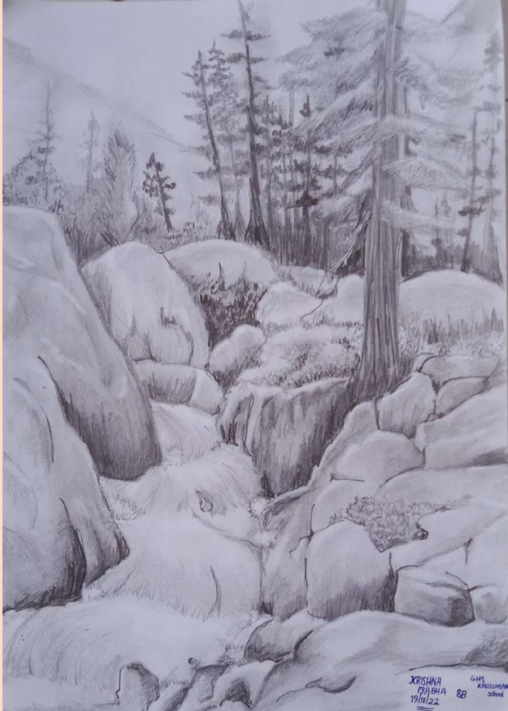
KRISHNA PRABHA 9B