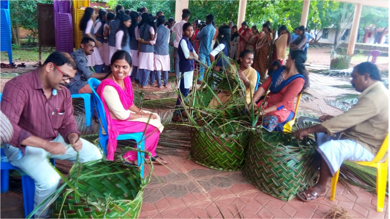
ഗ്രീൻ പ്രോട്ടോക്കോൾ സബ്ജില്ലാ കലോൽസവം തയ്യാറെടുപ്പ്