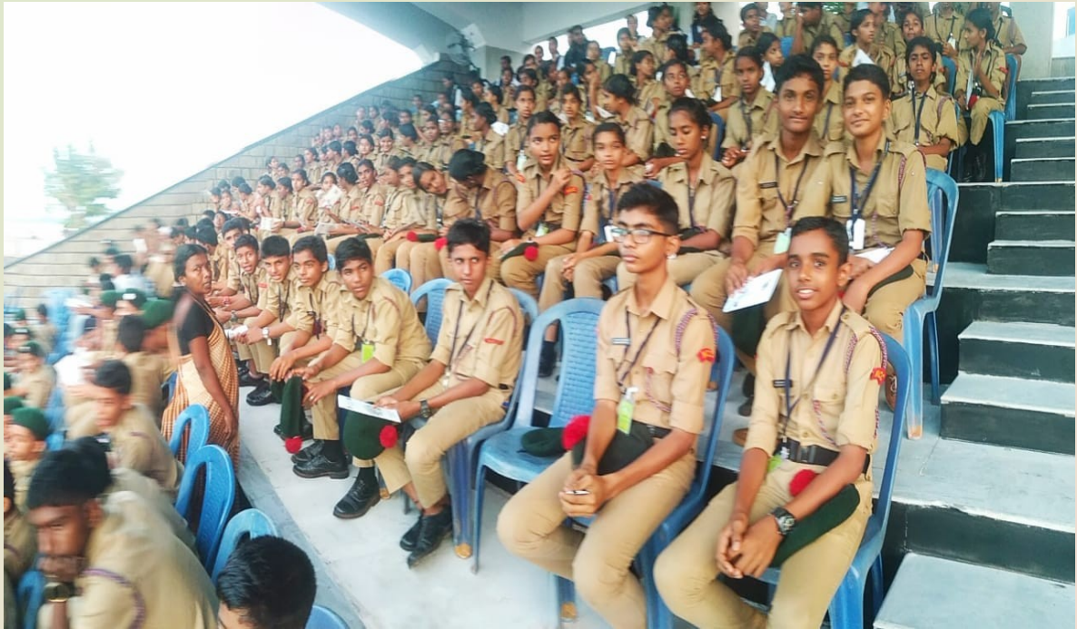
ഏഴിമല നാവിക അക്കാദമിക്ക് കളക്ട് പുരസ്കാരം നൽകാൻ വന്ന രാഷ്ട്രപതിയെ കാണാൻ എത്തിയ എൻ സി സി കേഡറ്റുകൾ.....