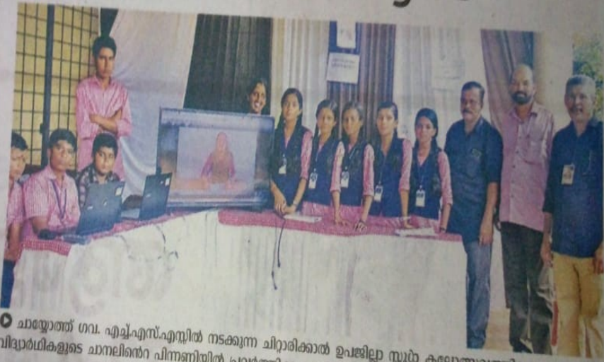
ചായോത്ത് ഗവ. എച്ച്.എസ്.എസ്സിൽ നടക്കുന്ന ചിറ്റാലിക്കാൽ ഉപജില്ലാ സ്കൂൾ കലോത്സവത്തിലെ വിദ്യാർത്ഥികളുടെ ചാനലിന്റെ പിന്നണിയിൽ പ്രവർത്തിക്കുന്നവർ

തിലേശ്വരം ഉപജില്ലാ സ്കൂൾ കലോത്സവത്തിന്റെ ഭാഗമായി കലോത്സവ വാർത്തയായി കാണാം. ഇത് വിദ്യാർത്ഥികളുടെ ചാനലിലൂടെയാണെന്നതാണ് പ്രത്യേകത. ചിറ്റാലിക്കാൽ ഉപജില്ലാ സ്കൂൾ കലോത്സവം നടക്കുന്ന ചായോത്ത് ഗവ. എച്ച്.എസ്.എസ്സിലെ വിദ്യാർത്ഥികളാണ് അവർ പഠിച്ച സാങ്കേതികവിദ്യകൾ ഉപയോഗിച്ച് കലോത്സവ വാർത്തകൾ ടെലിവിഷനിലൂടെ പ്രേക്ഷകരിലെത്തിക്കുന്നത്.