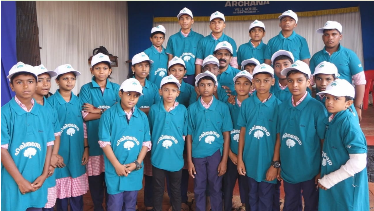
പ്രകൃതിയെ പ്ലാസ്റ്റിക് വിമുക്തമാക്കാൻ കേരള സർക്കാർ പദ്ധതിയായ ഹരിതസേന അംഗങ്ങൾ.....