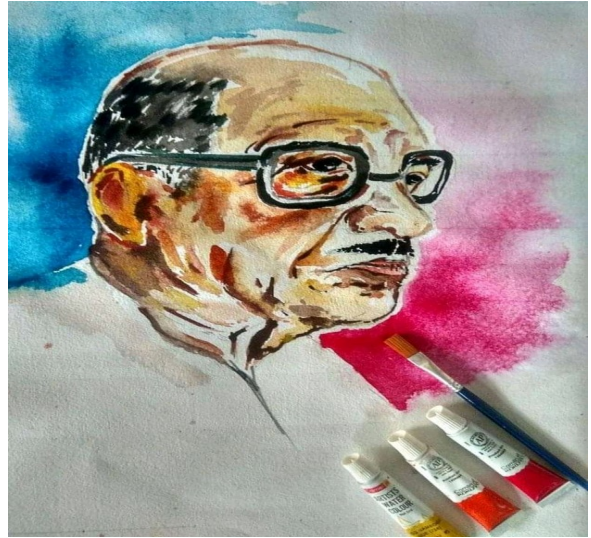
വൈഷ്ണവ് സി കെ