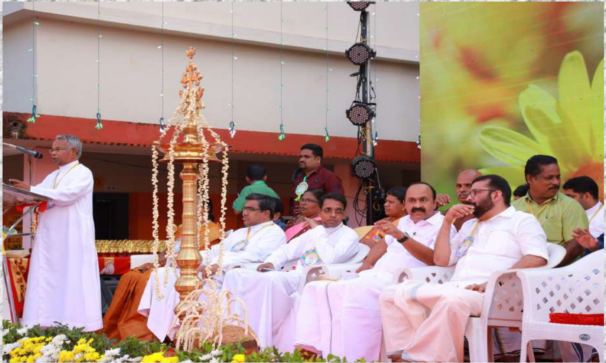
OUR ANNIVERSARY AND CENTENARY CELEBRATIONS