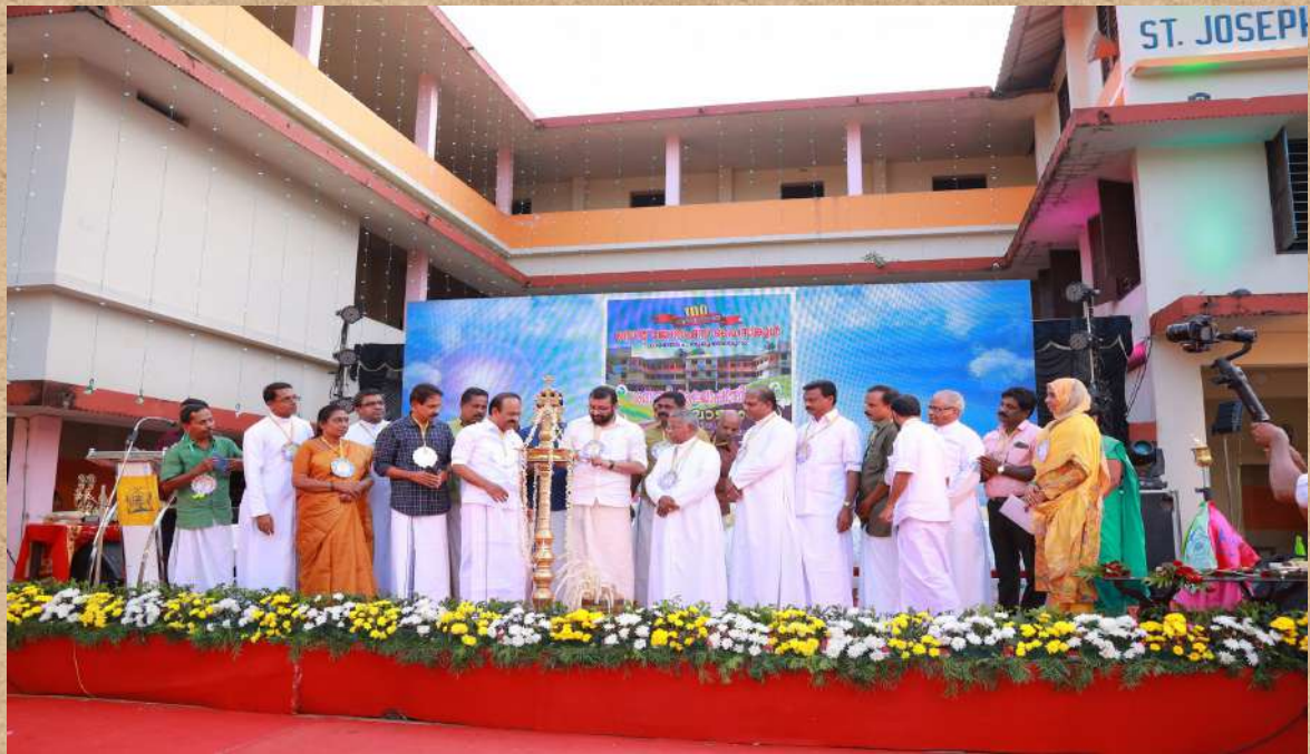
Our Anniversary and Centenary Celebrations