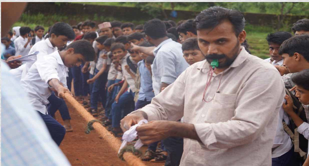
ഒരു പുഴയുടെ തീരത്ത് നടന്ന പരിപാടി