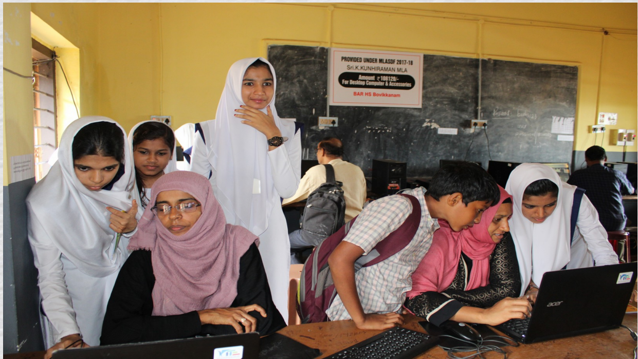
ബി എ ആർ എച്ച് എസ് ബോവിക്കാൻ