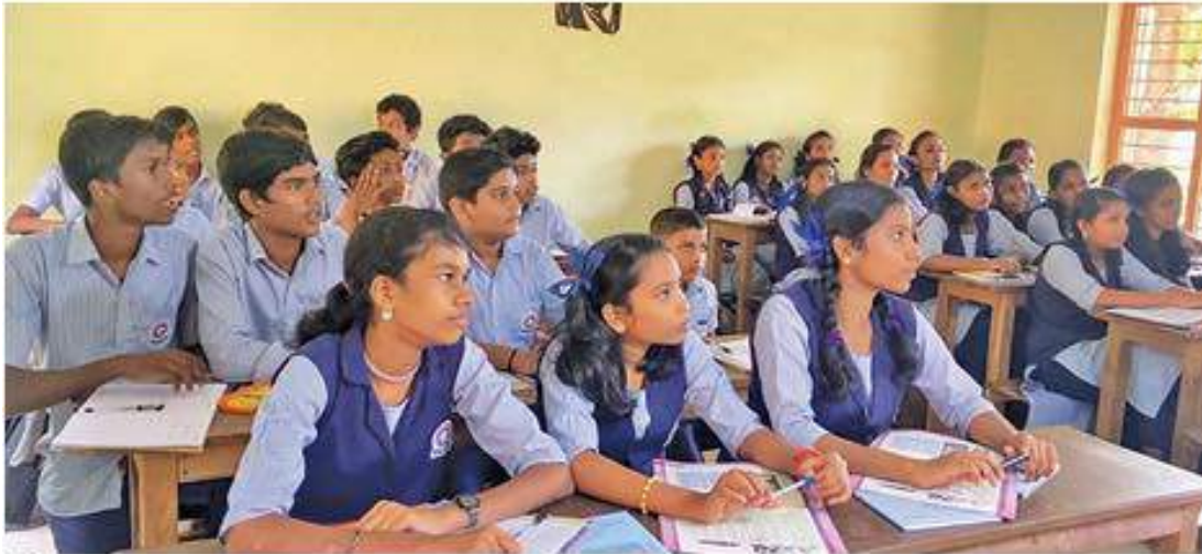
▶ വർണത്തുമ്പികൾ എന്ന ഹ്രസ്വചിത്രത്തിലെ ഒരു രംഗം

കുണ്ടറ ▶ വർണത്തുമ്പികളായി ഉയരങ്ങളിലേക്കെത്തുക എന്ന സന്ദേശവുമായി പഴങ്ങാലം ആർ.ശങ്കർ മെമ്മോറിയൽ ഹൈസ്കൂളിലെ വിദ്യാർഥികൾ തയ്യാറാക്കിയ ഹ്രസ്വചിത്രം 'ഇനിയും പറന്നുയരുന്ന വർണത്തുമ്പികൾ'ക്ക് ജില്ലയിൽ മൂന്നാംസ്ഥാനം.