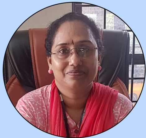
Yangtsy DB Headmistress GHSS Kottappuram

കൊട്ടപ്പുറം ഗവ: ഹയർസെക്കന്ററി സ്കൂളിലെ ലിറ്റിൽ കൈറ്റ്സ് അംഗങ്ങളുടെ നേതൃത്വത്തിൽ ഒരു ഡിജിറ്റൽ മാഗസിൻ തയ്യാറാക്കിയിരിക്കുകയാണ് കുട്ടികളിലെ സർഗ്ഗവാസനകൾ വളർത്തുക എന്ന പ്രക്രിയയോടൊപ്പം കമ്പ്യൂട്ടർ അനുബന്ധ സാങ്കേതിക വിദ്യകൾ ഉപയോഗിച്ച് അവരുടെ രചനകളെ ഡിജിറ്റലൈസ് ചെയ്യുകയും കൂടി ചെയ്യുമ്പോൾ രണ്ടു തരത്തിലുള്ള വികാസം കുട്ടികളിൽ സാധ്യമാകുന്നു . മാഗസിനിൽ രചനകൾ തയ്യാറാക്കിയവർക്കും അവയെ ഒരു ഡിജിറ്റൽ മാഗസിൻ എന്ന രൂപത്തിലേക്ക് മാറ്റാൻ പ്രയത്നിച്ച ലിറ്റിൽ കൈറ്റ്സ് അംഗങ്ങൾക്കും അവർക്ക് പിന്തുണയായി കൂടെ നിന്ന ലിറ്റിൽ കൈറ്റ്സ് മിസ്ട്രസിനും അഭിനന്ദനങ്ങൾ നേർന്നുകൊണ്ട് ഈ സംരംഭത്തിന് എല്ലാ വിധ ആശംസകളും അറിയിക്കുന്നു.