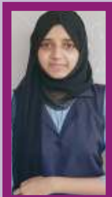
ചീഫ് എഡിറ്റർ (ലിറ്റിൽ കൈറ്റ് അംഗം )

Little Kite ക്ലബ്ബ് ഒരു അത്ഭുതമാണ് .ലോകം ഐ ടി മേഖലയിൽ വൻ കുതിച്ചുചാട്ടം നടത്തുകയാണ് .വിവരവിനിമയ സാങ്കേതിക വിദ്യ ജീവിതത്തിൽ ഒഴിച്ച് കൂടാനാവാത്ത ഒന്നായി മാറുമ്പോൾ, തീർച്ചയായും KITE ലെ പാവ്യപ്രവർത്തനങ്ങൾ ഞങ്ങൾക്ക് ഒരു മുതൽകൂട്ടാണ് .ഇതിന്റെ ഭാഗമാവാൻ കഴിഞ്ഞതും ഞങ്ങളുടെ കഴിവുകൾ വളർത്തിയെടുക്കാൻ ഒരു കൈതാങ്ങാവാൻ സഹായിച്ച കൈറ്റിന്റെ സജ്ജിത ടീച്ചർക്കും നിഷ ടീച്ചർക്കും നന്ദി അറിയിക്കുന്നു "ആരംഭം 2025 " ന്റെ നിറങ്ങൾ ചാലിച്ച എഴുത്തുകൾക്കും ,വരകൾക്കും ഒപ്പം സഹായിച്ച മുഴുവൻ കൂട്ടുകാർക്കും എന്റേയും little kite ന്റെയും നന്ദി അറിയിക്കുന്നു