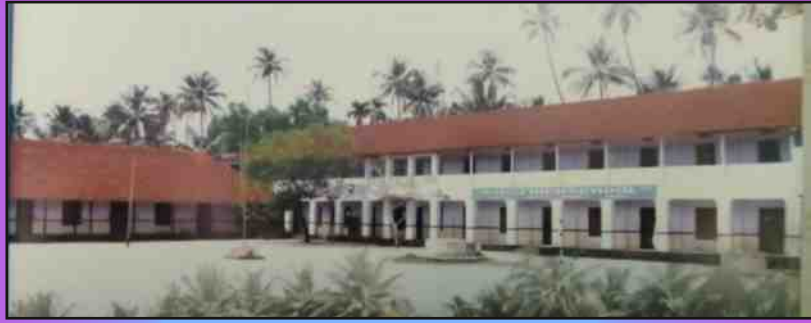
എസ് എം എച്ച് എസ് തൈക്കാട്ടുശ്ശേരി