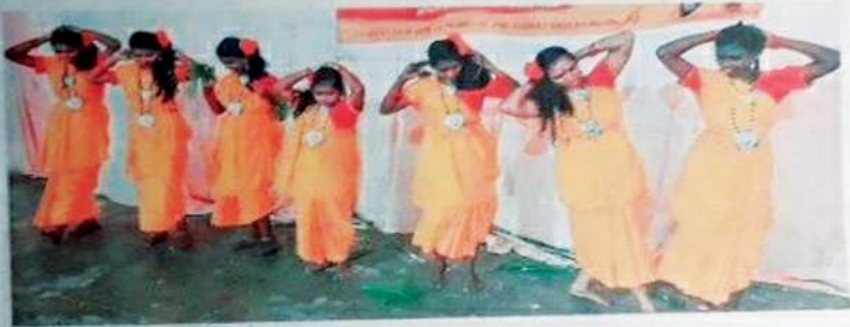
ഊരുതാളം ട്രൈബൽ ഫെസ്റ്റിൽ അവതരിപ്പിച്ച കലാപരിപാടി

ഗോത്രസംസ്കാരത്തിന്റെ ആത്മാവിനെ തൃപ്തിപ്പെടുത്താനും പീച്ചി ഗവണ്മെന്റ് സെക്കന്ററി സ്കൂളിലെ ഉദ്യോഗസ്ഥരുടെയും അധ്യാപകരുടെയും സഹായത്തോടെ ഏകദേശം 100 പേർ പങ്കെടുത്ത് കലാപരിപാടി ആഘോഷിച്ചു. പീച്ചി ഗവണ്മെന്റ് സെക്കന്ററി സ്കൂളിലെ ഉദ്യോഗസ്ഥരുടെയും അധ്യാപകരുടെയും സഹായത്തോടെ ഏകദേശം 100 പേർ പങ്കെടുത്ത് കലാപരിപാടി ആഘോഷിച്ചു.