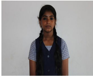
നന്ദന എസ് 8 ഡി

മനസ്സിനെ പിടിച്ചു കുലുക്കിയ ഈ അനുഭവം ഇവിടെ ഒരു ഓർമ്മക്കുറിപ്പായി ഞാൻ അവതരിപ്പിച്ചു കഴിഞ്ഞു. നമ്മുടെ ഓർമ്മകളിൽ വീണ്ടും ഒരു പ്രളയക്കെടുതി ഉണ്ടാകരുത് എന്ന് ആഗ്രഹിക്കുകയാണ് ഞാൻ.