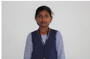
ദേവുട്ടി.എസ് 8 എ

അല്ലയോ സ്വർണ്ണമാർന്ന പുഷ്പമെ നിൻ കാന്തിതൻ മുമ്പിൽ സ്വർണ്ണം പോലുംമെന്നുമല്ല നിന്റെ കർത്തവ്യങ്ങളിൽ നിന്നെ ആത്മാർത്ഥത എത്ര മഹത്വരം. നിന്റെ അമ്മയാം സസ്വത്തെ നീ നിന്റെ സ്നേഹമാകുന്ന സ്വർണ്ണ നിറം കൊണ്ട് ശോഭനീയമായിതീർക്കുന്നു മാത്യത്വം നീ വിസ്മരിക്കാതെ നിൻമുഖം വേണ്ടി നീ ജീവിച്ചു ആയതിനാൽ നീ ഈ മനുഷ്യരെകാട്ടിലും മഹത്വംമുള്ള തായിതീർന്നു. ഭൂമിയിലെ ഓരോ വസ്തുക്കൾക്കു മുളള മഹത്വം എന്നി മാനവാരാശി അറിയുന്നു വെ അന്തി ഭൂമി സ്വർഗം പോലെ പരിലസിക്കും കാഞ്ചന പുഷ്പം പോലെ പരിപാവനമായിത്തീരും..