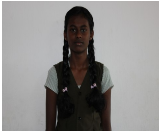
സ്വാതി .റ്റി .എസ് 10 എ