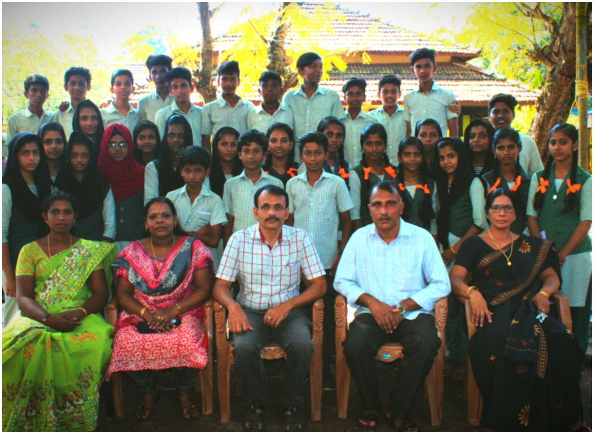
ലിറ്റിൽ കൈറ്റ്സ് ക്ലബ്ബ് ജി. എച്ച്. എസ്. മംഗലം

ഒളി പൂർണ്ണതയിൽ എത്തിക്കുന്നതിൽ മംഗലം സ്കൂളിലെ ലിറ്റിൽ കൈറ്റ്സ് അംഗങ്ങൾക്കും ഞങ്ങൾക്ക് പ്രചോദനവും വിലയേറിയ അഭിപ്രായങ്ങളും നൽകിയ പ്രഥമ അധ്യാപകർക്കും മറ്റ് സുമനസ്സുകൾക്കും നന്ദി, നന്ദി