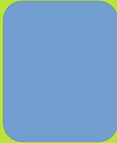
AFSAL E S LITTLE KITES MASTER