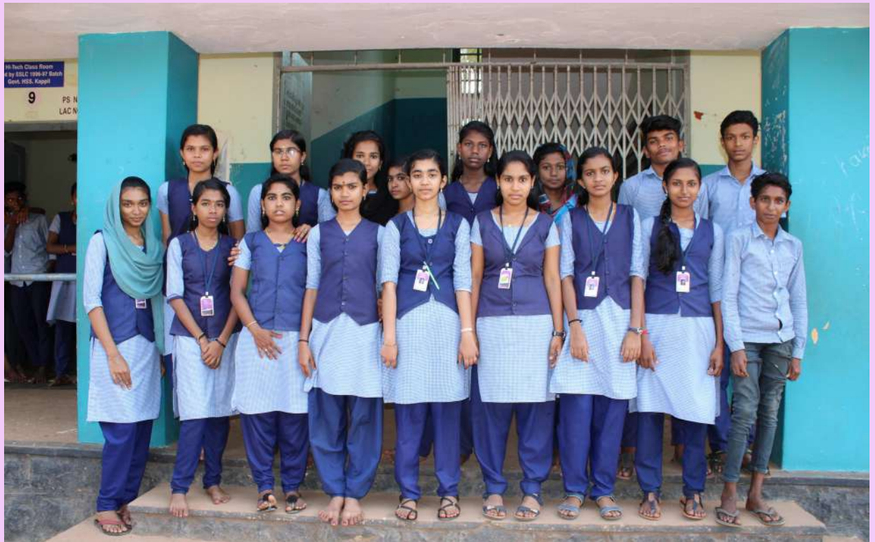
ഈ ലിറ്റിൽ കൈറ്റ്സ്