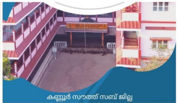
കണ്ണൂർ സൗത്ത് സബ് ജില്ല