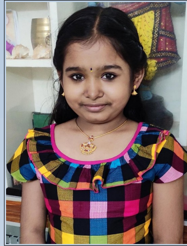
ദേവികആർ 6 C