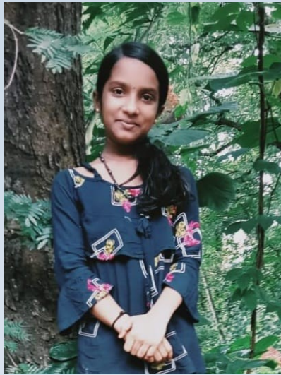
എൻ കെഅഞ്ജുഷ 6C