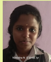
നിമിഷ എൻ എസ് വി എച്ച് എസ് സി ഒന്നാം വർഷം

ഇന്നത്തെ നമ്മുടെ വിദ്യാഭ്യാസ സമ്പ്രദായത്തിൽ ദൃശ്യമാധ്യമങ്ങൾക്ക് മഹത്തായ സ്ഥാനമുണ്ട്. പറഞ്ഞുകേട്ടത് പഠിപ്പിക്കുക എന്ന രീതിയിലേക്ക് വിദ്യാഭ്യാസം മാറിയിരിക്കുകയാണ്.