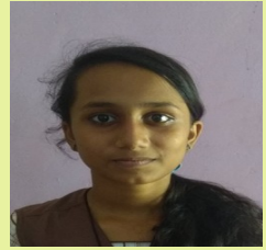
അഗന്യ ടി എസ് കളാസ് VII B