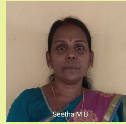
സീത എം ബി പ്രീ പ്രൈമറി ടീച്ചർ