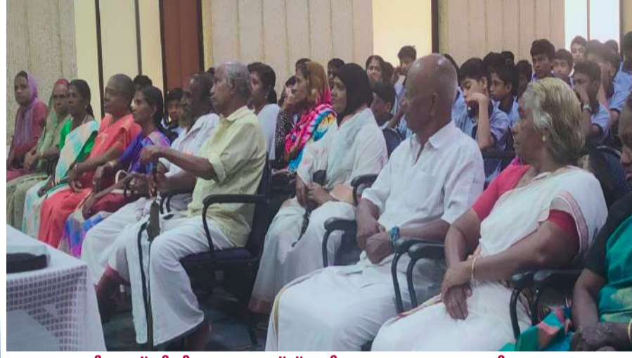
പള്ളുരുത്തി എസ്.ഡി.പി.വൈ.ബോയ്സ് സ്കൂളിലെ ലോകവയോജന ദിനാചരണം