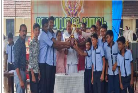
കായികപ്രതിഭകളെ ദേവസ്വംമാനേജർ ആദരിക്കുന്നു