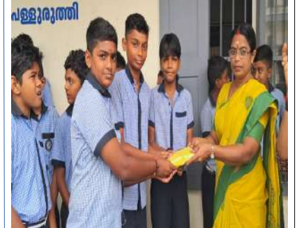
എച്ച്.എം പുക്കളമത്സര വിജയികൾക്ക് സമ്മാനങ്ങൾ നൽകുന്നു.