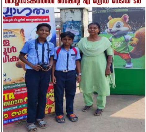
സ്കൂൾ കായികമേള ഡോക്ട്രൈനേഷൻ ചുമതല വഹിച്ച ലിറ്റിൽ കൈറ്റ്സ് ടീം