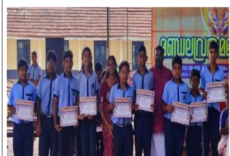
ശാസ്ത്രനാടകത്തിൽ സെക്കന്റ് എ ഗ്രേഡ് നേടിയ ടീം