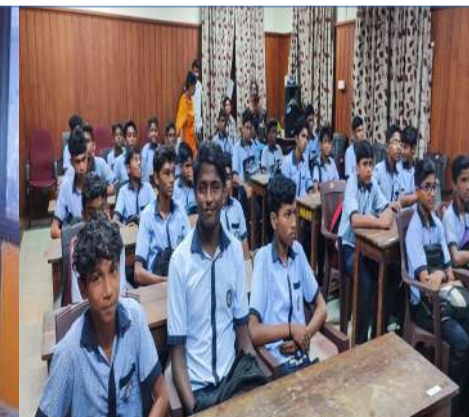
ഹൈക്കോടതിയിൽ അഭിഭാഷകരുടെ ക്ലാസ് ശ്രവിക്കുന്ന കുട്ടികൾ