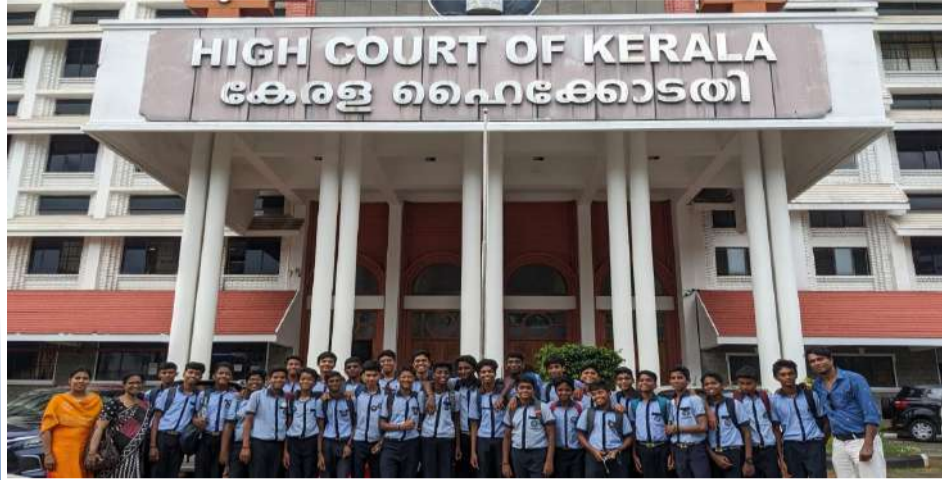
എറണാകുളം ഹൈക്കോടതി സന്ദർശിച്ച എസ്.ഡി.പി.വൈ ബോയ്സ് ഹൈസ്കൂളിലെ റൂപ്പൽ കുട്ടികളും അധ്യാപകരും

എസ്.ഡി.പി.വൈ സ്കൂളിലെ കുട്ടികൾ എറണാകുളം ഹൈക്കോടതി സന്ദർശിച്ചു.