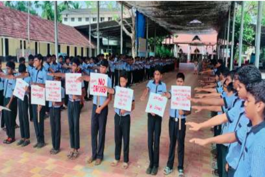
ഗാന്ധിജിയന്നിയോടനുബന്ധിച്ച് കുട്ടികൾ സ്കൂളിൽ ലഹരിക്കെതിരെയുള്ള കുട്ടികളുടെ അണിചേർന്നു.

ഒക്ടോബർ രണ്ട് ഗാന്ധിജിയന്നിയോടനുബന്ധിച്ച് എസ്.ഡി.പി വൈ.ബോയ്സ് ഹൈസ്കൂളിൽ വിമുക്തി ക്ലബ്ബിന്റെ ആഭിമുഖ്യത്തിൽ വിവിധ ലഹരിവിരുദ്ധ പ്രവർത്തനങ്ങൾ സംഘടിപ്പിച്ചു. വിദ്യാർത്ഥികളും അധ്യാപകരും അനുധ്യാപകരും ചേർന്ന് വിദ്യാലയത്തിൽ ശുചീകരണ പ്രവർത്തനങ്ങൾ നടത്തി. വിമുക്തി ക്ലബ്ബിലെ വിദ്യാർത്ഥികളെ ഉൾപ്പെടുത്തി ഒരു യോഗം ചേരുകയും ലഹരിവിരുദ്ധ സന്ദേശം നൽകുന്ന ഒരു ഹ്രസ്വചിത്രം പ്രദർശിപ്പിക്കുകയും ചെയ്തു. കലന്തൻ ബഷീർസംവിധാനം ചെയ്ത എൻഎച്ച്ആർഎസി എഫ് ( നാഷണൽ ഹ്യൂമൻ റൈറ്റ്സ് ആൻഡ് ആൻറി കറപ്ഷൻ ഫോഴ്സ്) നിർമ്മിച്ച കുട്ടിയോദ്ധാവ് എന്ന ചിത്രമാണ് പ്രദർശിപ്പിച്ചത്. കൂടാതെ വിദ്യാർത്ഥികളെയും രക്ഷകർത്താക്കളെയും ഉൾപ്പെടുത്തി ലഹരി വിരുദ്ധ സന്ദേശം പകർന്നുകൊണ്ട് ഒരു ബോധവൽക്കരണ ക്ലാസും സംഘടിപ്പിച്ചു. എക്സൈസ് ഡിപ്പാർട്ട്മെന്റ് നൽകിയ കവചം എന്ന പുസ്തകവും കുട്ടികൾക്ക് നൽകി. ലഹരിക്കെതിരെയുള്ള പ്രവർത്തനങ്ങളിൽ പങ്കാളികളാകാൻ സമൂഹത്തോട് ആഹ്വാനം ചെയ്തുകൊണ്ട് ലഹരിക്കെതിരെ കുട്ടികളുടെ സൃഷ്ടിച്ച സൂളിനോട് ചേർന്നുള്ള ക്ഷേത്രത്തിന് മുൻവശത്തായാണ് കുട്ടികളുടെ തീർത്തത്. ബന്തം ക്ലാസിലെയും എട്ടാം ക്ലാസിലെയും കുട്ടികളാണ് ലഹരിക്കെതിരെയുള്ള കുട്ടികളുടെ അണിചേർന്നത്. സ്കൂൾ അസംബ്ലിയിൽ വിമുക്തി ക്ലബ്ബിന്റെ കോർഡിനേറ്റർ ലഹരി വിരുദ്ധ സന്ദേശം നൽകി.