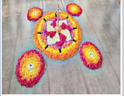
പുക്കള മത്സരത്തിന്റെ ഭാഗമായി ബെത്ത് ബീയിലെ കുട്ടികൾ തയ്യാറാക്കിയ പുക്കളം

വിദ്യാഭ്യാസവകുപ്പിന്റെ നിർദ്ദേശപ്രകാരം വയനാട് ദുരന്തത്തിന്റെ പശ്ചാത്തലത്തിൽ ഈവർഷം ഓണം വളരെ ലളിതമായാണ് ആഘോഷിച്ചത്. ആഘോഷത്തിന്റെ ഭാഗമായി ക്ലാസ് തലത്തിൽ അത്തപ്പക്കള മത്സരം നടത്തി. ഉച്ചയ്ക്ക് കുട്ടികൾക്ക് പായസം നൽകി. കളർ ഡ്രസ്സിട്ടാണ് കുട്ടികളെല്ലാം ഓണാഘോഷത്തിനെത്തിയത്. രാവിലെ 9.30 ന് തന്നെ കുട്ടികൾ സ്കൂളിലെത്തി ഉച്ചയ്ക്ക് പുക്കളമത്സര വിജയികളെ പ്രഖ്യാപിച്ചു. സ്കൂൾ ഗണിതശാസ്ത്ര ക്ലബിന്റെ ആഭിമുഖ്യത്തിലാണ് മത്സരം നടത്തിയത്. സമ്മാനങ്ങൾ ഓണാവധി കഴിഞ്ഞ് സ്കൂളു തുറന്നതിനുശേഷമാണ് നൽകിയത്.