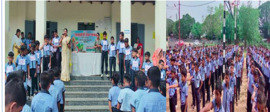
കേരളപ്പിറവി ദിനത്തോടനുബന്ധിച്ച് നടത്തിയ പ്രത്യേക അസംബ്ലി