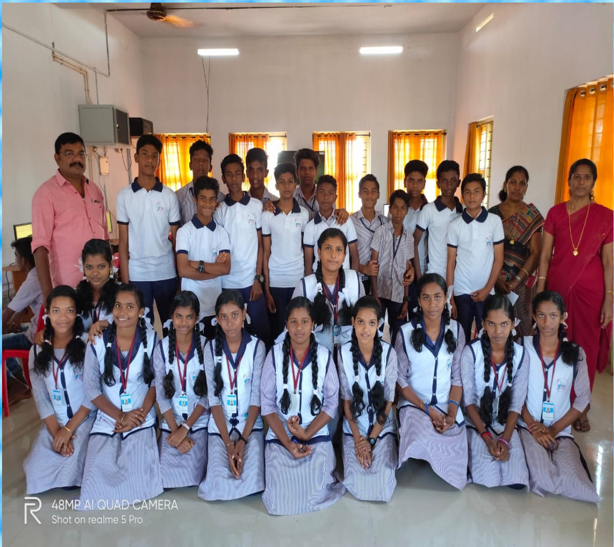
R 48MP AI QUAD CAMERA Shot on realme 5 Pro