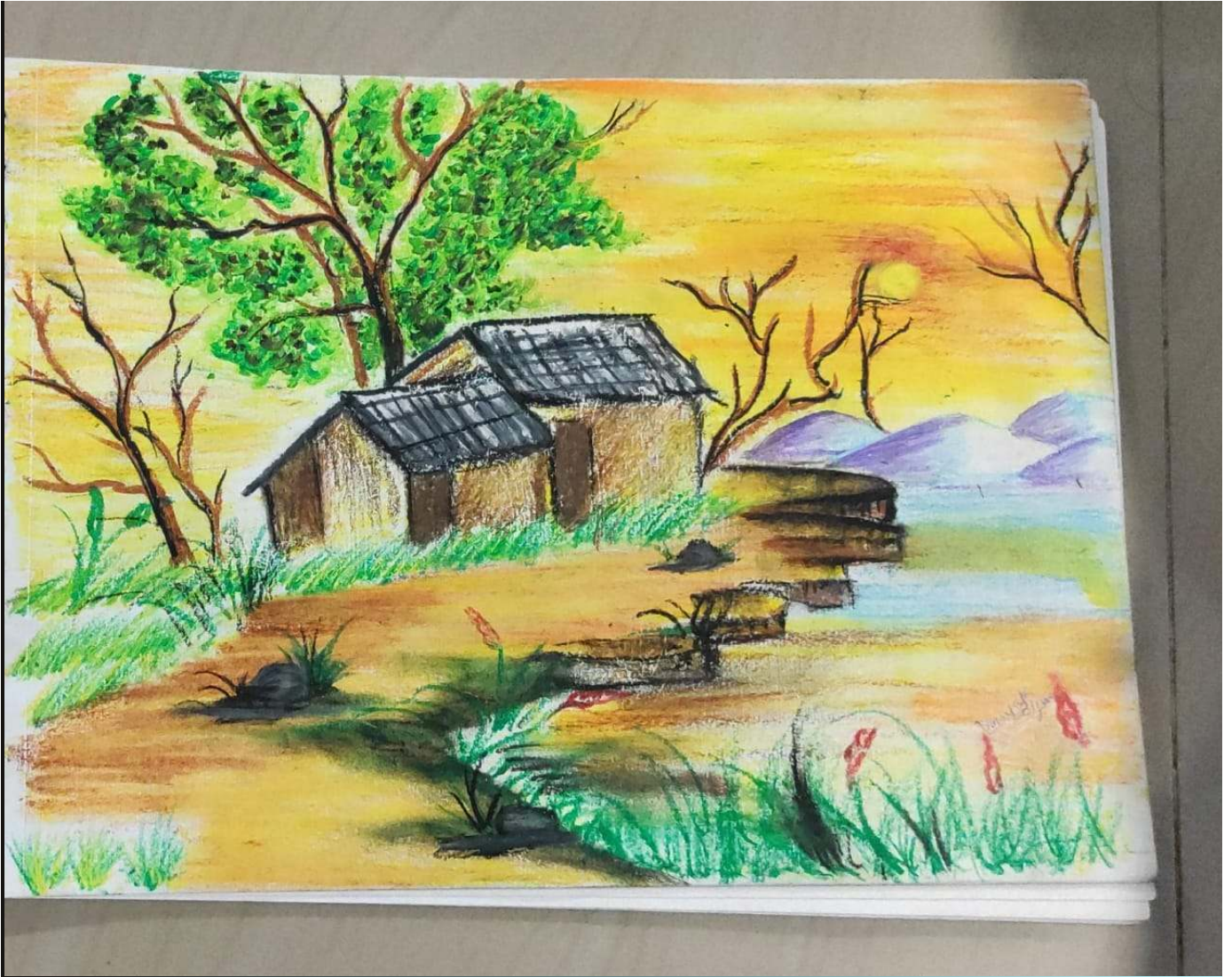
NANDANA BIJULAL 9D