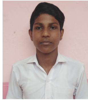
Sanju mon k k 9B

സന്യാസി പറഞ്ഞു, നിങ്ങൾ നിങ്ങളുടെ വീടുകളിൽ ചെന്ന് അപ്പനോടും അമ്മയോടും ക്ഷമ ചോദിപ്പിൻ . അന്നേരം നിങ്ങൾക്കും നിങ്ങളുടെ ദൈവത്തെ കാണാൻ കഴിയും കുട്ടികൾ എല്ലാവരും വീടുകളിലേക്ക് പോയി അപ്പനോടും അമ്മയോടും ക്ഷമ ചോദിച്ചു . കുട്ടികൾ സന്തോഷവാനായി ഇരുന്നു ..