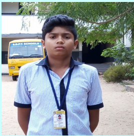
Al-Ameen V.J. 9 D