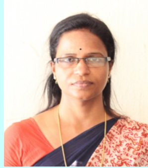
ഷീജി സി എസ്