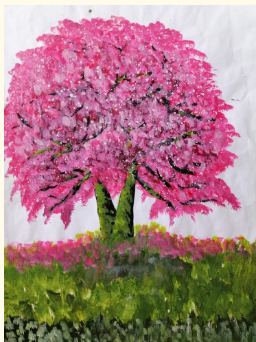
കവർ പേജ് ഡിസൈൻ നിഖ മറിയം. പി - 8C