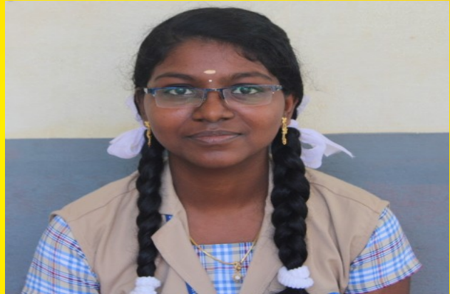
ASIN SAGARAM A ,10 .F

I could remember those days; In which I hesitated from that plays But I had one dream in my mind That was to become a doctor and be kind.