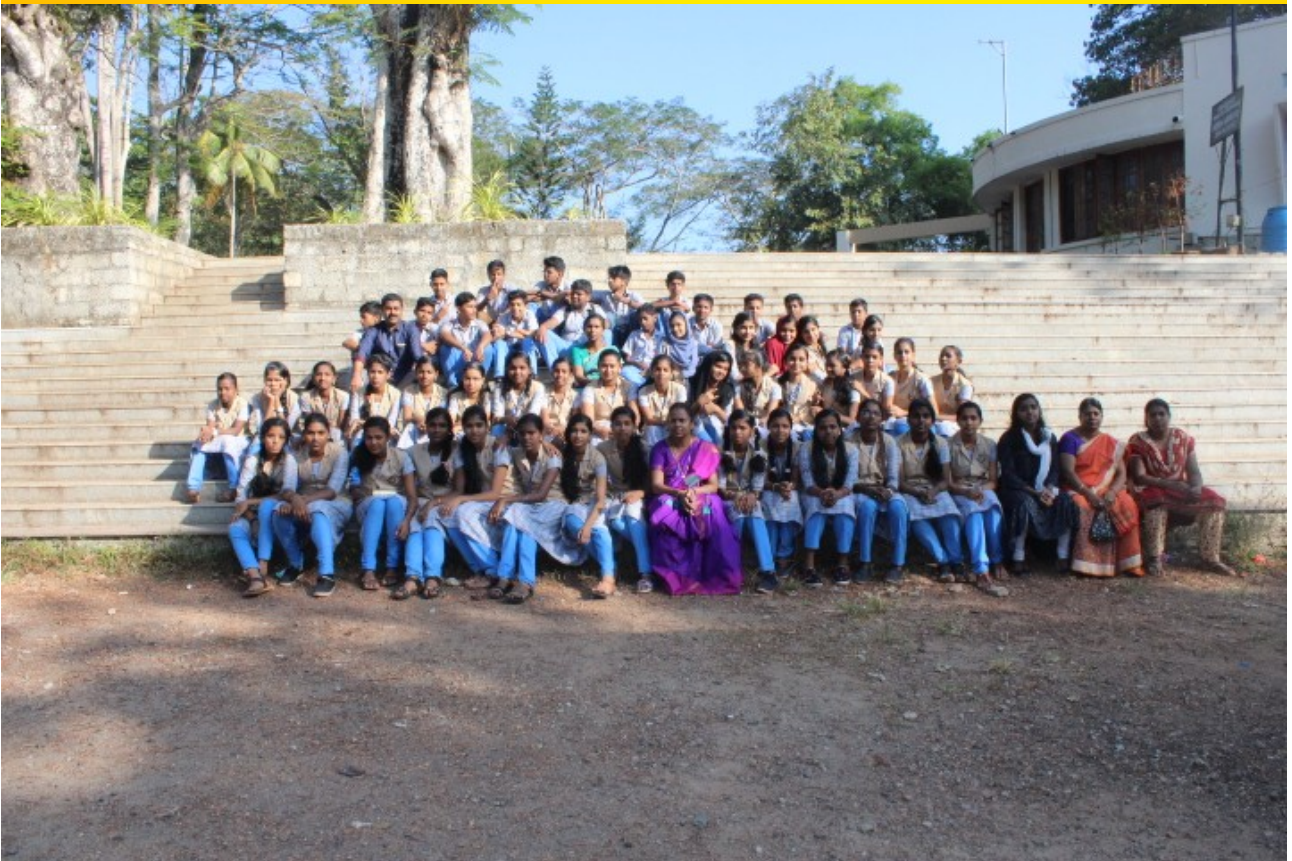
ഓർമയിലെ ചില മുഹൂർത്തങ്ങൾ

ലിറ്റിൽ കൈറ്റ്സുകൾക്കായി ഇത്തരം പ്രവർത്തനങ്ങൾ സംഘടിപ്പിക്കുന്ന കേരളത്തിലെ വിദ്യാസ വകുപ്പിനും നേതൃത്വം നല്കുന്ന കൈറ്റ് ഓഫീസിലെ മാസ്റ്റർ ട്രെയിനർമാർക്കും ഇയവസരത്തിൽ നന്ദിയർപ്പിക്കട്ടെ.