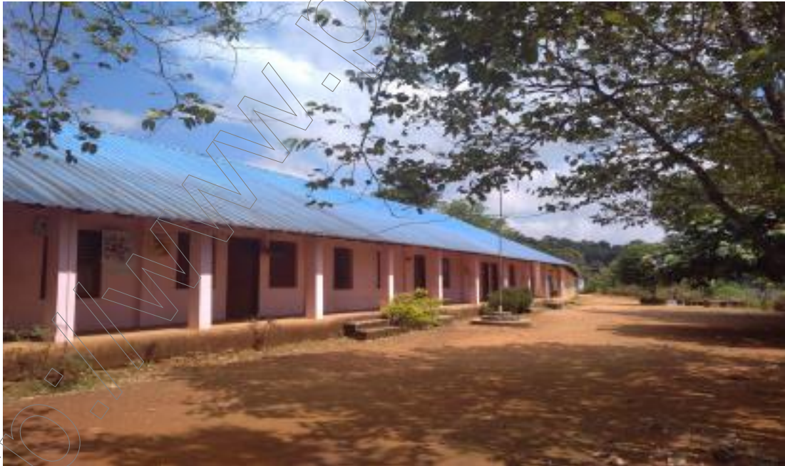
ജി. എച്ച്. എസ് തോപ്രാൻകുടി.