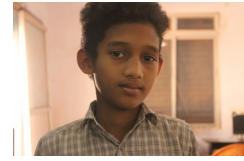
ഡാനിഷ് (6 B)