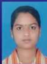
ജിയ മോൾ പി എ