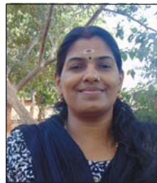
സ്മിത എസ്. എം.പി.ടി.എ. പ്രസിഡന്റ്