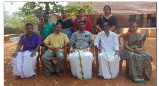
പി.ടി.എ. കമ്മിറ്റിയോടൊപ്പം ഹെഡ്മാസ്റ്റർ