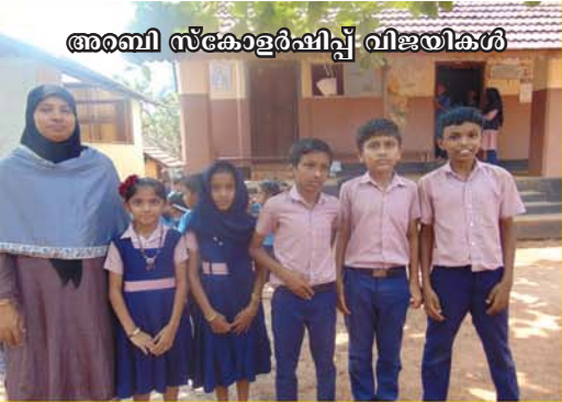
അറബി സ്കോളർഷിപ്പ് വിജയികൾ