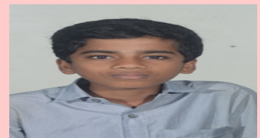
Sinaj P.S 9B