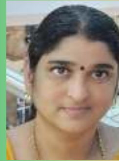
Vidya P R LK Mistress