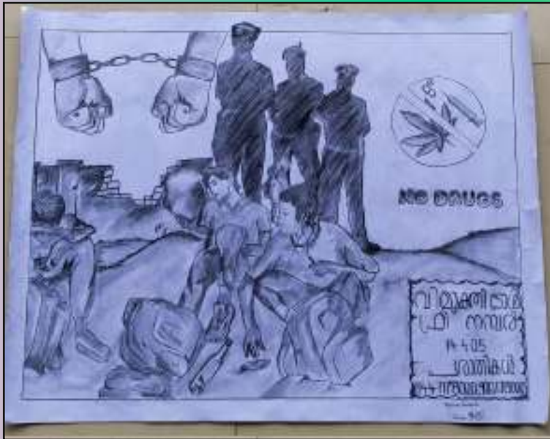
Abinav Raneesh 10