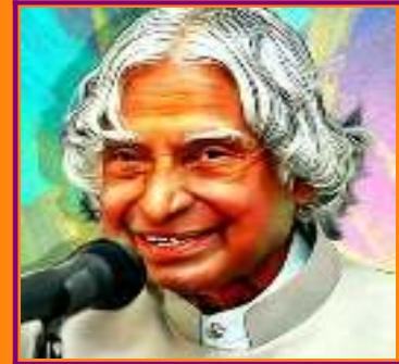
എ.പി.ജെ. അബ്ദുൽ കലാം