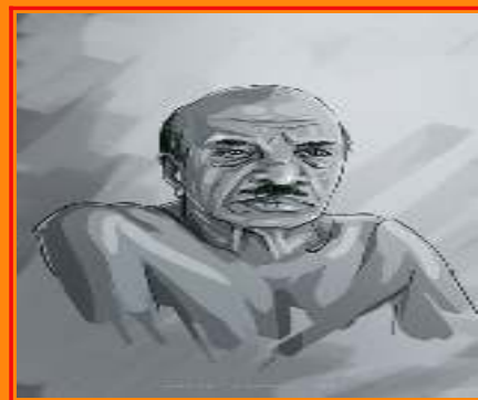
വൈക്കം മുഹമ്മദ് ബഷീർ