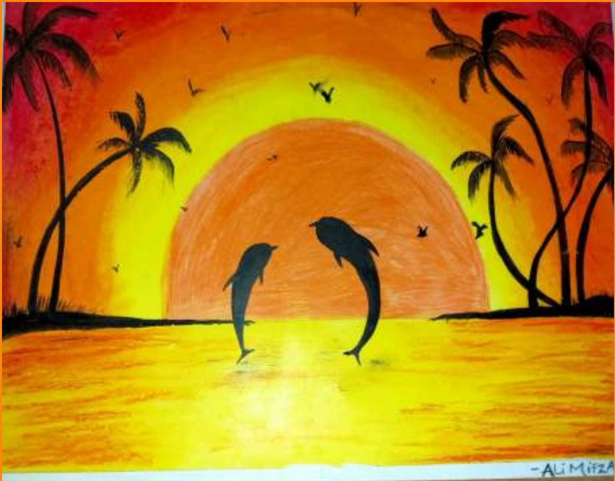
ALIMIFSAL CLASS 10