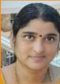
Vidya P R LK Mistress