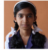
ശ്രീനന്ദ ഇ കെ-5B

ഒരു കാട്ടിൽ പീങ്കുരുക്കനും അവന്റെ ഉറ്റ ചങ്ങാതിയും താമസിച്ചിരുന്നു. കുരുക്കൻ എന്നായിരുന്നു ചങ്ങാതിയുടെ പേര്. എല്ലായ്പ്പോഴും കൃത്യമായി മറ്റുള്ളവരെ ഉപദ്രവിക്കലാണ് പീങ്കുരുക്കന്റെ വിനോദം. കുരുക്കൻയാകട്ടെ എല്ലാവരെയും അവനിഷ്ടമാണ്. കാറ്റിനെ അവനിഷ്ടമാണ്. തത്തയെ അവനിഷ്ടമാണ്. പുല്ലിനെ പോലും അവനിഷ്ടമാണ്. എന്തിന് അവന് ആ കാട്ടിലെ എല്ലാ ജീവജാലങ്ങളെയും ഇഷ്ടമാണ്. എന്തിനും അവൻ ശരിയുടെ ഭാഗത്തെ നിൽക്കുന്നു. ഒരു ദിവസം പീങ്കുറും കുരുക്കും കാട്ടിലെ കാഴ്ചകൾ കാണാനിറങ്ങിയതാണ് അപ്പോൾ കുരുക്കിന് വലിയൊരു പാൽ കട്ട കിട്ടി. അവൻ കൂട്ടുകാരനോട് കാര്യം പറഞ്ഞു. പീങ്കുറുവിന് അത് ഒറ്റയ്ക്ക് കഴിക്കണം എന്ന് താന്നി. കുരുക്കിന്റെ മുന്നിൽ വെച്ച് തിന്നാൽ അവരും അത് തിന്നാലോ എന്ന് പീങ്കു മനസ്സിൽ വിചാരിച്ചു. അവനൊരു സൂത്രം തോന്നി. എന്നിട്ട് കുരുക്കിനോട് പറഞ്ഞു. കുരുക്കി ചങ്ങാതി നമുക്കിത് നാളെ രാവിലെ കഴിക്കാം ഇപ്പോൾ നമുക്ക് രണ്ടു കാട്ടു മാങ്ങ തിന്നാം. അതു കേട്ടതും കരടി പറഞ്ഞു. ആ നീ പറഞ്ഞത് ശരിയാ ..... അങ്ങനെ അവർ രാത്രി ഉറങ്ങാൻ കിടന്നു. കരടി നേരത്തെ തന്നെ ഉറങ്ങിപ്പോയി. കുറുക്കൻ മെല്ലെ എണീറ്റു. പാൽ കട്ട രണ്ടു തവണ കടിച്ചു. അപ്പഴേക്കും കരടി ഞെട്ടി ഉണർന്നു. എന്നിട്ട് കൂട്ടുകാരനോട് ചോദിച്ചു. നീ എവിടെ പോയതാ?.. ഓ ഞാനെന്റെ അടുപ്പുകാരന്റെ മോളുടെ പാലു