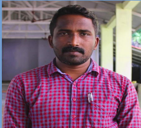
SREEKANTH P R STAFF EDITOR