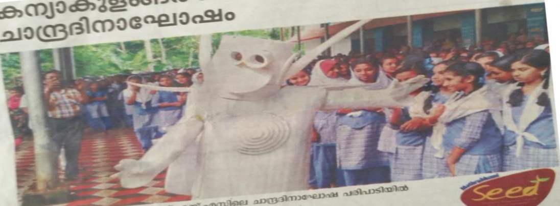
കന്യാകുളങ്ങര ഗേൾസ് എച്ച്.എസ്.എസിലെ ചാന്ദ്രദിനാഘോഷ പരിപാടിയിൽ ചാന്ദ്രമനുഷ്യൻ വിദ്യാർഥിനികൾക്കൊപ്പം

വെമ്പായം ▶ കന്യാകുളങ്ങര ഗേൾസ് എച്ച്.എസ്.എസിൽ മാതൃഭൂമി സീഡ് ക്ലബിന്റെയും സയൻസ്, സോഷ്യൽ സയൻസ് ക്ലബ്ബുകളുടെയും നേതൃത്വത്തിൽ ചാന്ദ്രദിനാഘോഷം സംഘടിപ്പിച്ചു. ശാന്തസാഹിത്യ പരിഷത്തിന് അർപ്പിച്ച ചാന്ദ്രമനുഷ്യൻ പരിപാടി വിദ്യാർഥിനികൾ