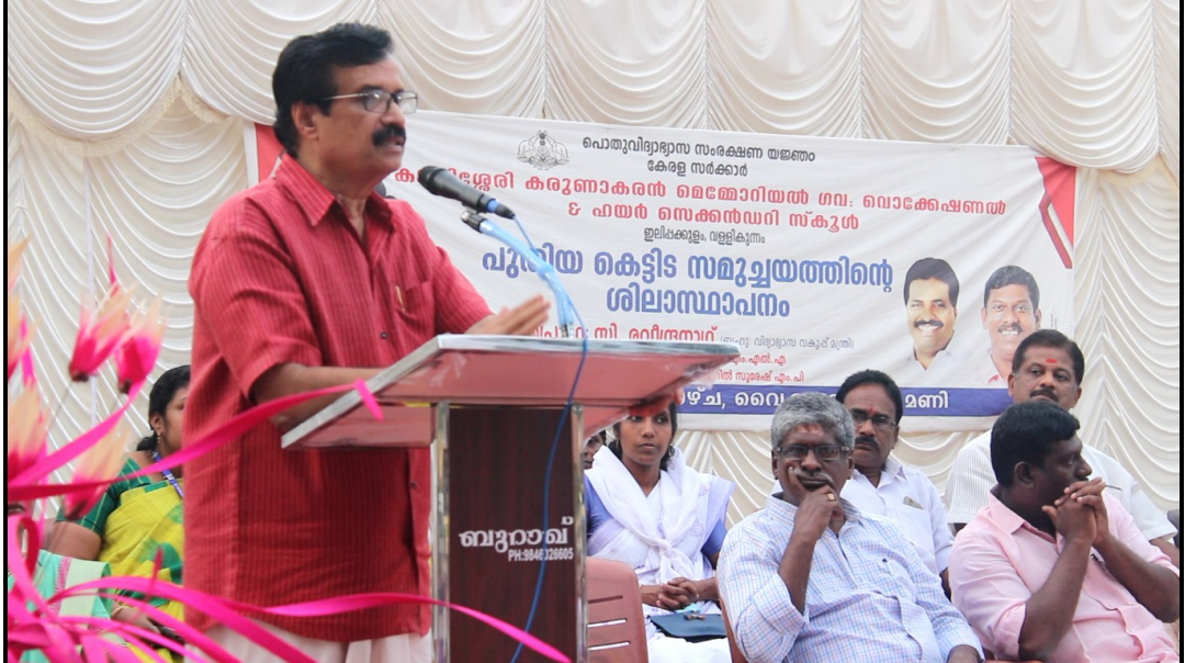
ഞങ്ങളുടെ സ്കൂൾ ഹൈ ടെക് ആക്കാൻ പുതിയ കെട്ടിട ഉത്ഘാടനം ബഹു വിദ്യാഭ്യാസ വകുപ്പ് മന്ത്രി ശ്രീ .പ്രൊഫ.രവീന്ദ്രനാഥ് നിർവഹിക്കുന്നു