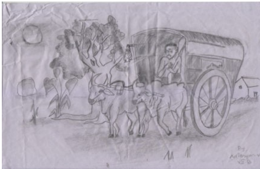
ആദിത്യൻ വി 7B