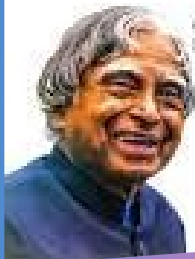
എ പി ടി അബ്ദുൾകരീം Inspirational Quotes Malayalam

നിങ്ങളുടെ പിന്നിൽ നിന്ന് കൊണ്ട് നിങ്ങളെക്കുറച്ച് കുറ്റം പറയുന്നവരെ ശ്രദ്ധിക്കേണ്ട... അവരെ വിട്ടുകൊടുക്കുക, കാരണം ശരിക്കും പറഞ്ഞാൽ അവർ നിങ്ങളെക്കാൾ മണ്ടി പിറകിലാണ്... അത് കൊണ്ടാണ് അവർക്ക് നിങ്ങളുടെ പിന്നിൽ നിന്ന് കൊണ്ട് കുറ്റം പറയേണ്ടി വരുന്നത്