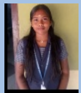
ATHIRA S CLASS IX