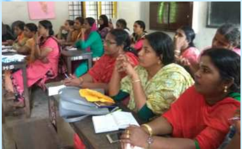
അമ്മമാർക്ക് ഐ. ടി. ക്ലാസ്സ്.....