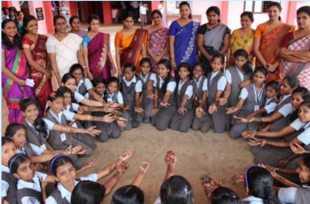
ഈട് ആഘോഷം ചൈലാഞ്ചിയിടൽ.....