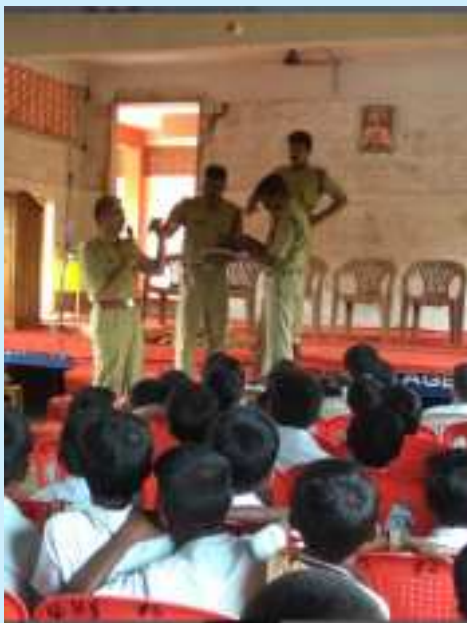
ചയർ ആറ്റ് സെഷ്നി.....